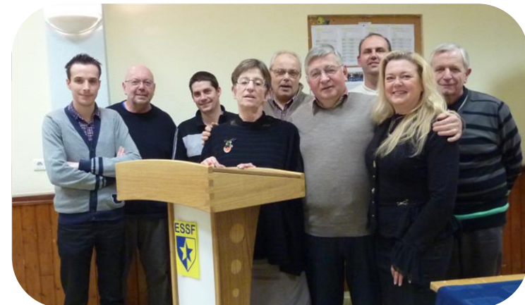
Le Président et les responsables de sections