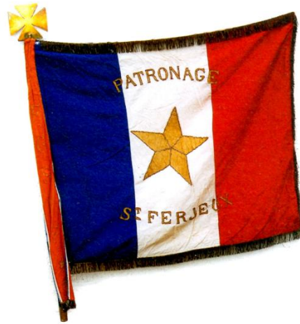
Un des premiers drapeaux de l'Étoile Sportive de Saint-Ferjeux

La plupart des associations sportives et culturelles créées à la même époque ont longtemps été considérées comme des «patros».